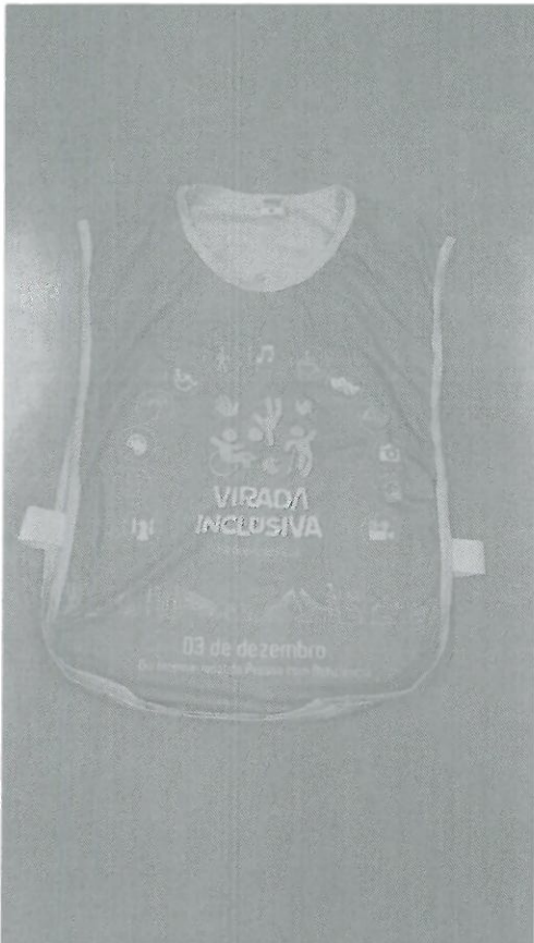
Colete - frente