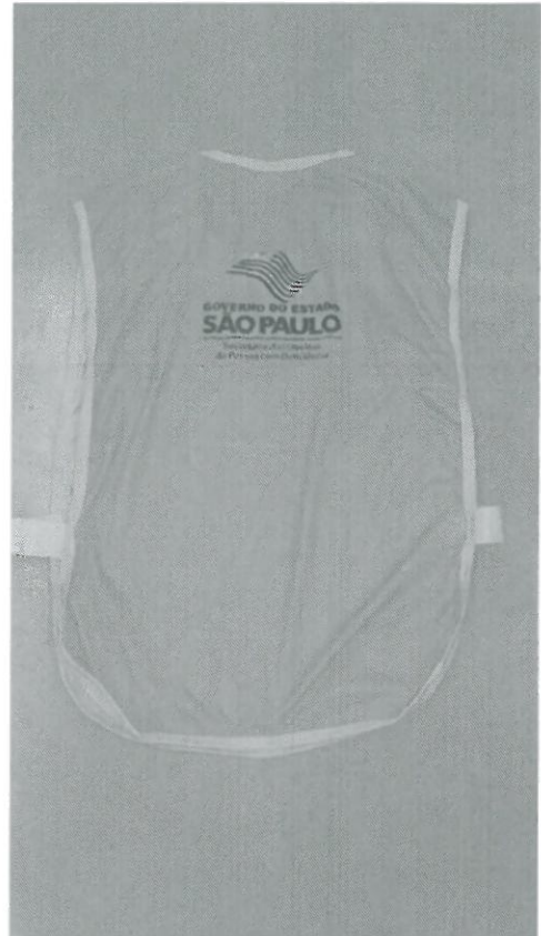
Colete - costas